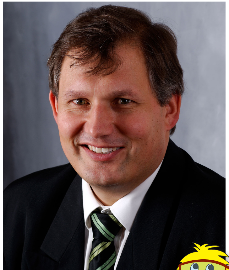
Olje- og energiminister Terje Riis-Johansen vil utrede lik nettleie for alle i Norge.