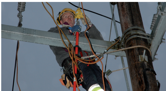
FSN mener at leveringssikkerhet må komme foran utnyttelse av markedskreftene.